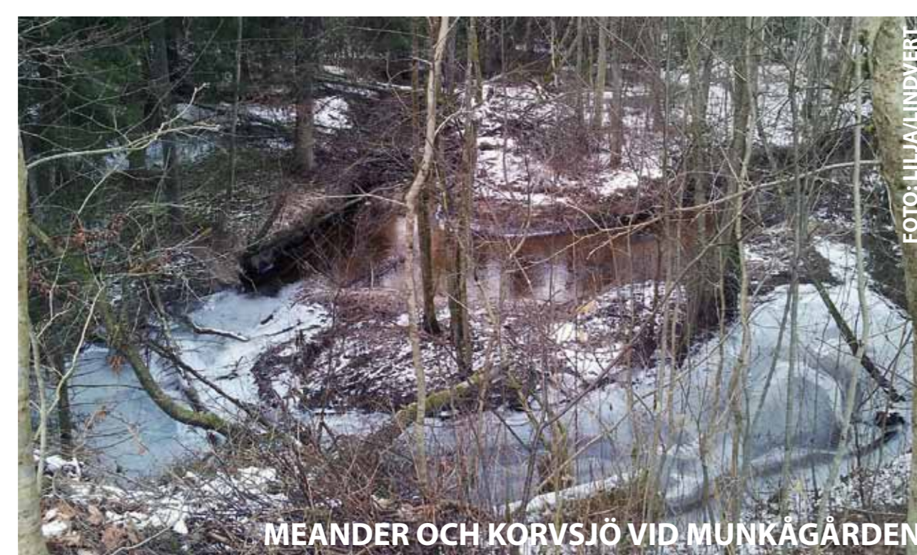
MEANDER OCH KORVSJÖ VID MUNKÅNGÅRDEN

När en slinga bearbetats tillräckligt, kan den bryta igenom ett näs och en ny vattenfåra bildas. Den slinga som saknar vattenflöde bildar så småningom en korvsjö.