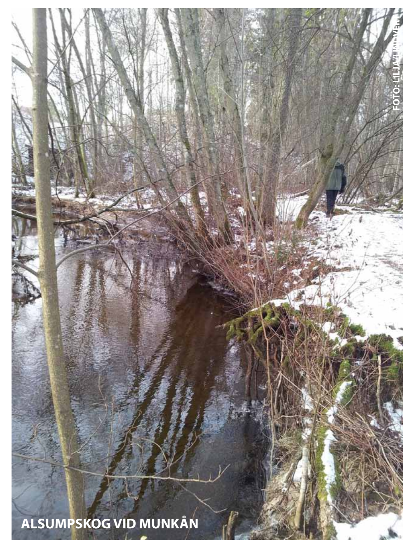
ALSUMPSKOG VID MUNKÅN