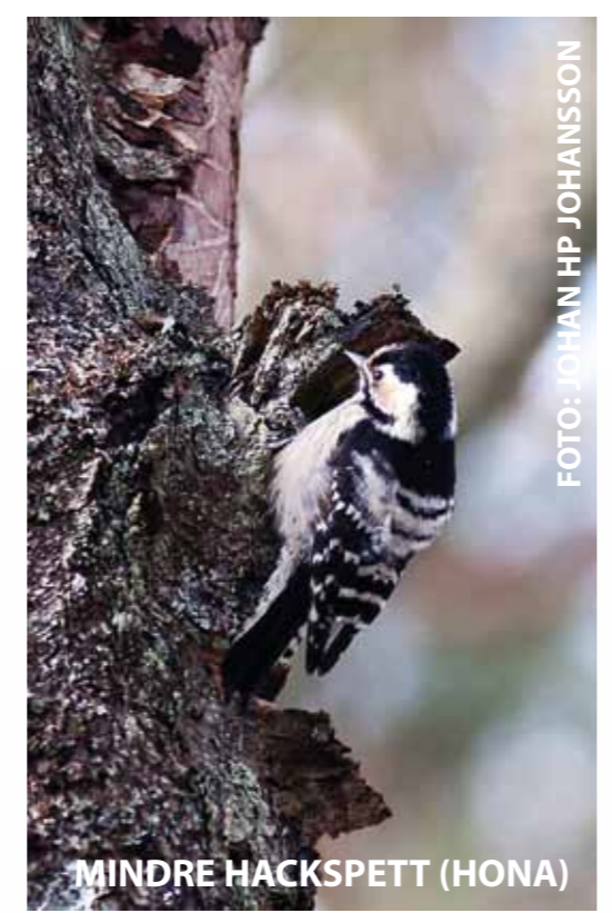
MINDRE HACKSPETT (HONA)